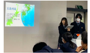
昨年度のプレゼン大会の様子

この修学旅行は、単なる観光旅行ではありません。STEAM教育の視点を取り入れた特別なプログラムで、学びと体験を融合させたユニークな旅となりました。生徒たちは自然や文化、技術に触れながら、未来へのヒントを得られるような充実した時間を過ごしました。その様子をダイジェストでお届けします!